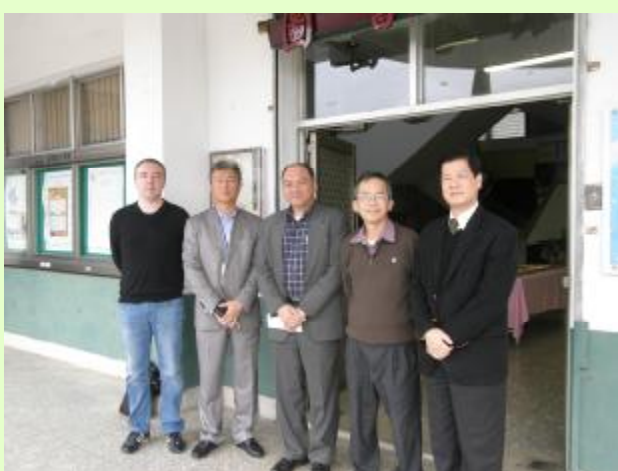
系上外國教師 系主任及本校同仁