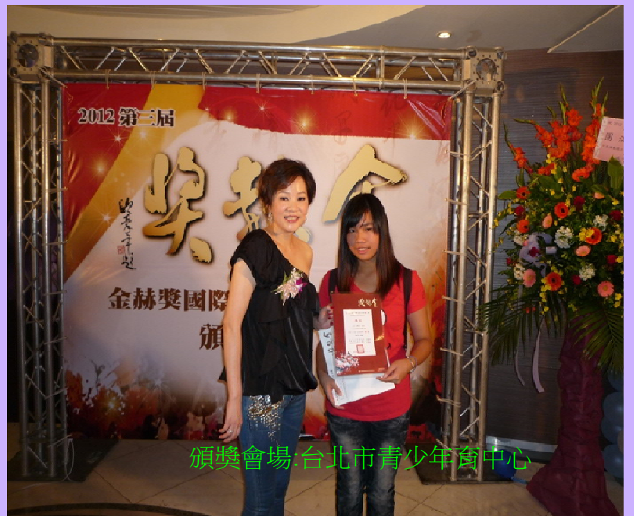
頒獎會場:台北市青少年會中心

也能自我要求,這何嘗不是讓青少年多了解一些台灣民俗的方法?你我都走過年輕歲月,正如"人不輕狂枉少年",不是嗎?心得:當老師給我這份國際性的簡章時,我很訝異,也很興奮,因為這是我第一次參加國際性的比賽,所以我花了很多的心力和心思去想做好這份作品,去找尋符合這次比賽的題目,我利用了放學後的剩餘時間和假日,去完成這件作品,過程雖然辛苦,但這也讓我的繪畫技巧更熟練,更精準,當得知我入圍時,真是既興奮又開心,希望再複選時可以有更好的成績,而複選時是要去現場領獎,坐在台下等待時,我的心情很緊張,當叫到我的時候我的心情頓時飛上雲霄,開心得不得了,當我上台領獎的那一刻,好有成就感,我迫不及待的想跟親朋好友分享這種喜悅,這件作品我之因為會選"家將"是因為我想將台灣的民情風俗,介紹給其他國家,所以很感謝主辦單位給了我優選的名次,也感謝老師們的鼓勵與支持,讓我們有機會可以為校之光,我會更努力,以求更好的成績。