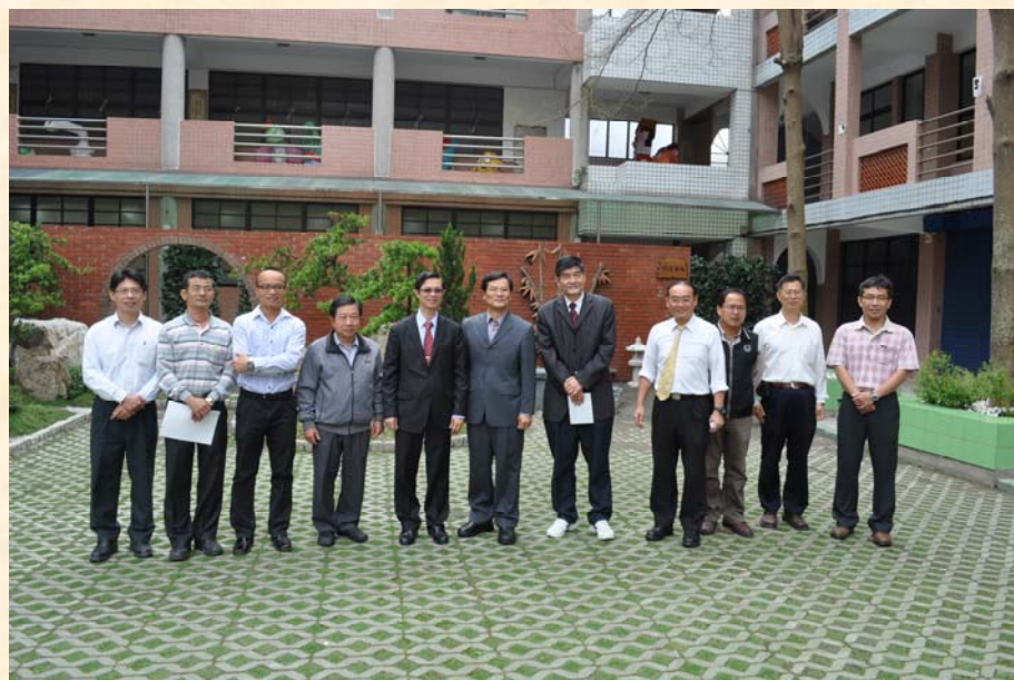
參訪本校樹海廣場