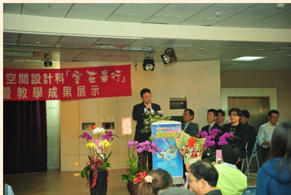
彰化市市長 邱建富