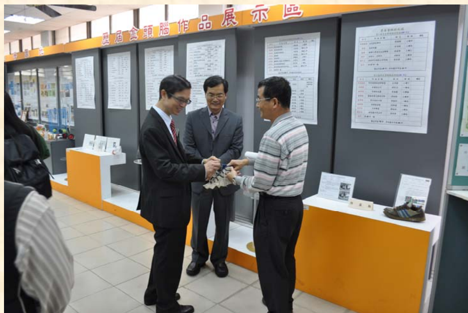
參訪本校創造力中心