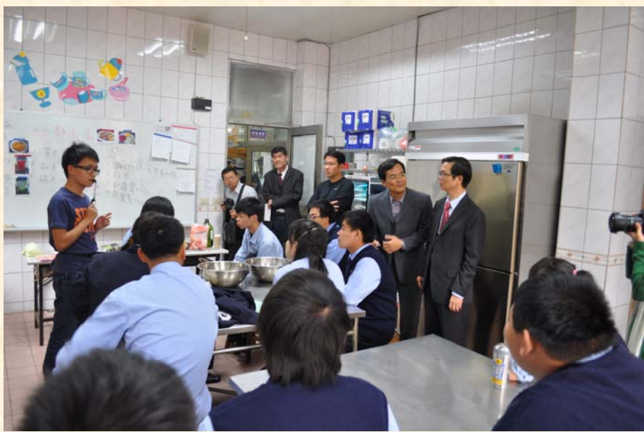
巡視本校綜合職能科教學