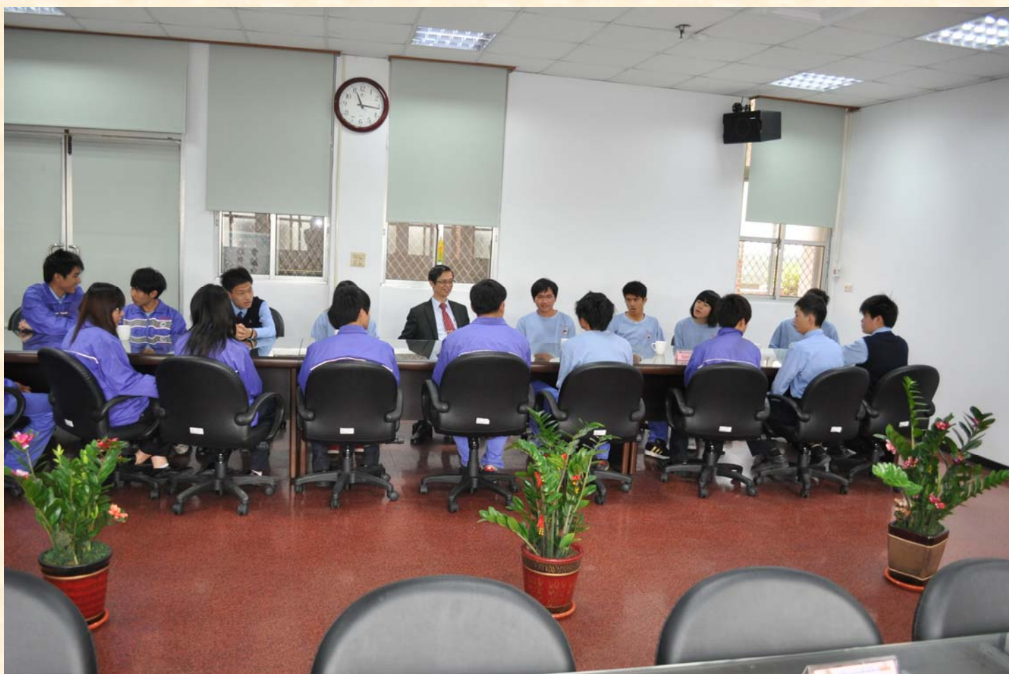
署長與本校學生座談