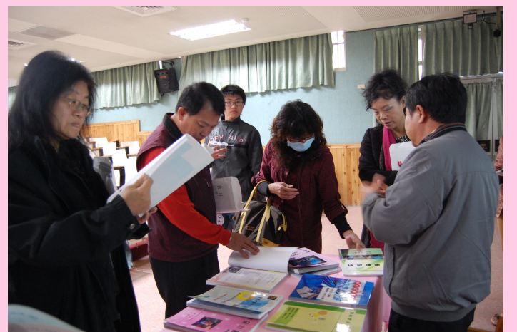
關心孩子的家長參考著備審資料，並且認真詢問師長們相關問題。