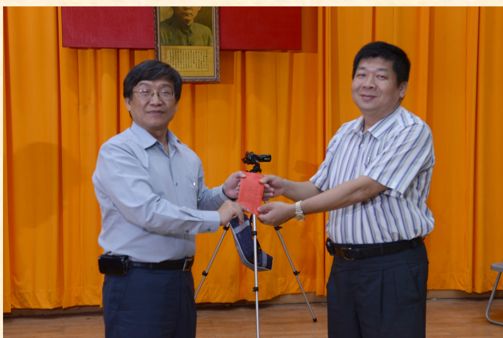
白會長棟樑致贈花蓮高農獎勵金