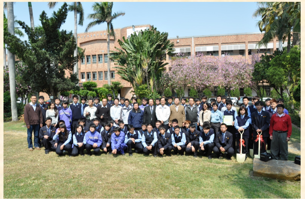
曾校長錦長與參加活動師生合影