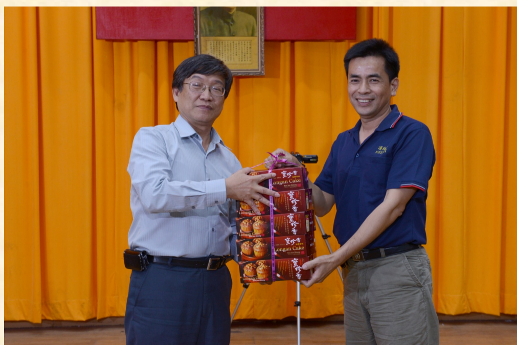
黃顧問文貴致贈花蓮高農彰化名產