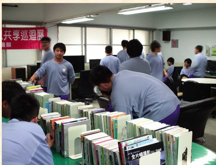
本校同學參觀書展

本報發行對象為本校教職員工、家長、學生、校友及教育先進。 訂閱或退報請 email : fw5408@yahoo.com.tw