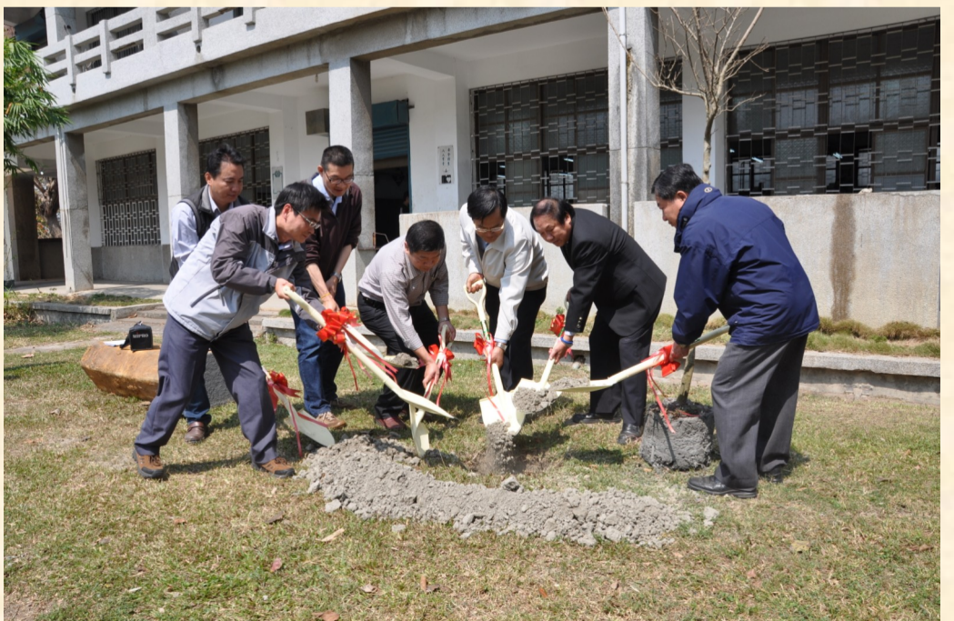
曾校長錦長與家長會長及處室主任植樹合影