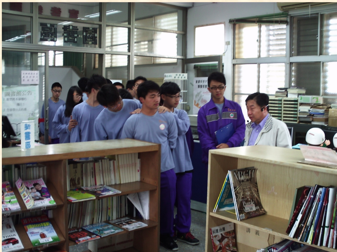
方主任為本校同學導覽圖書館