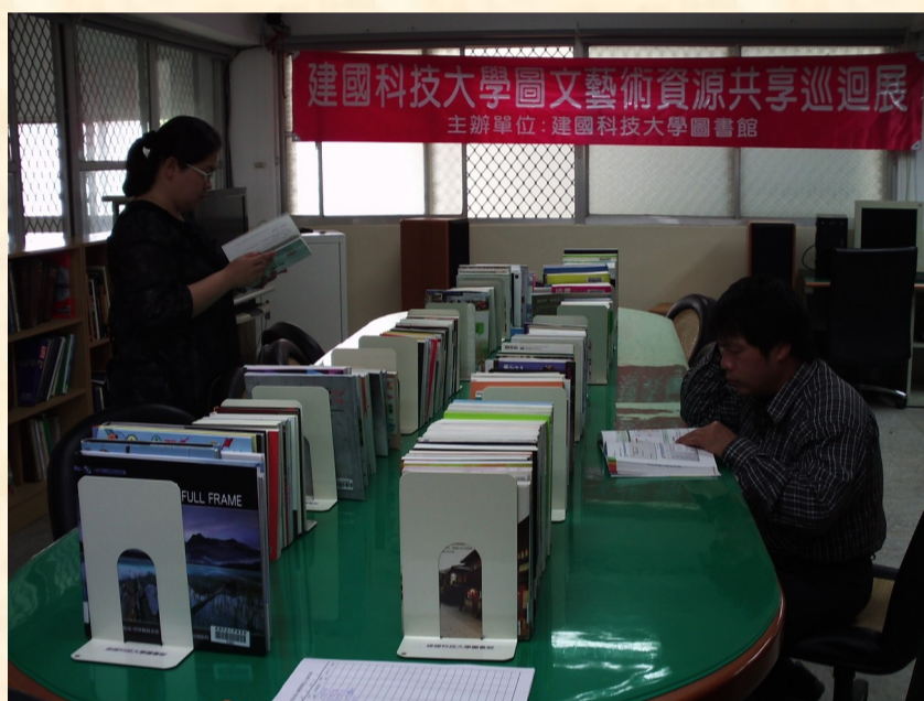
本校教職同仁參觀書展