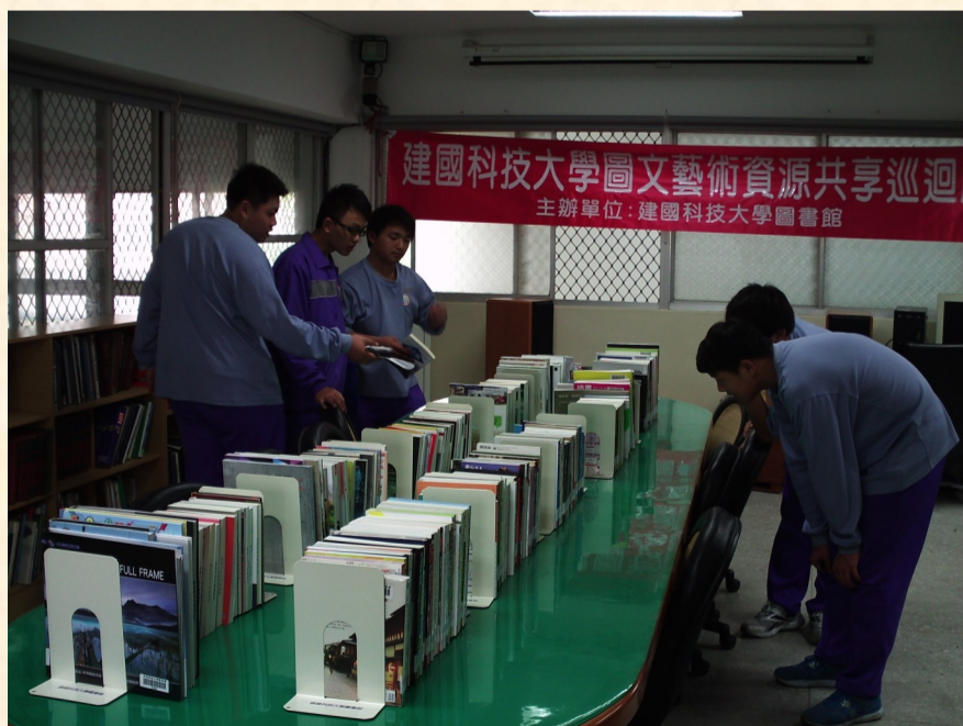
本校同學參觀書展