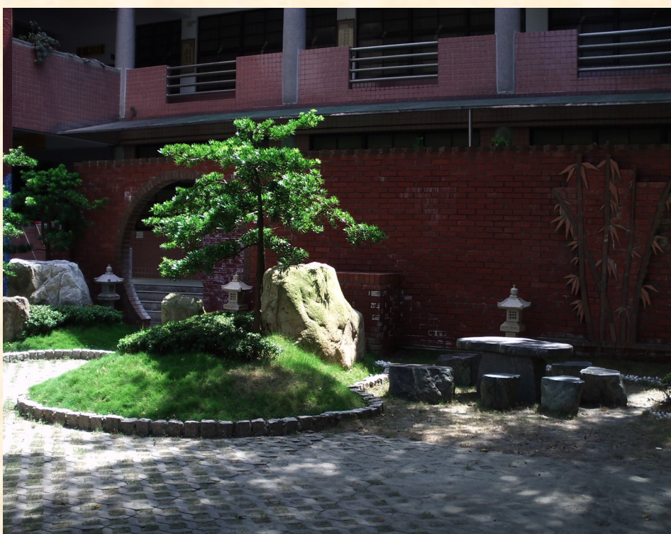
美麗的角落-山水景觀造景