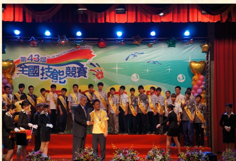
與副總統合影留念