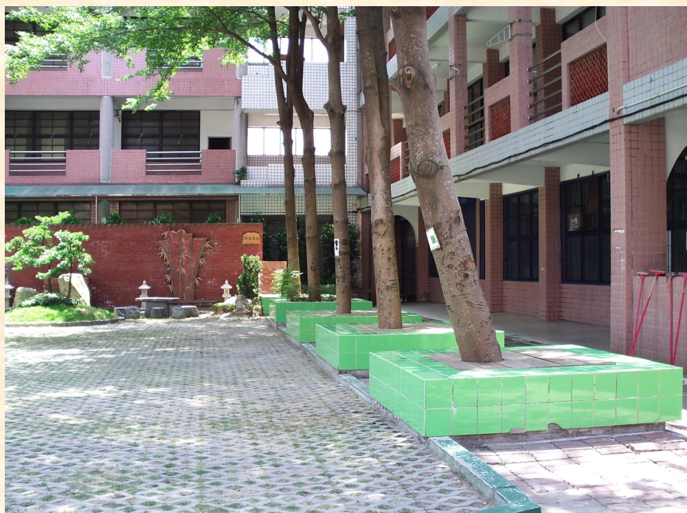
樹蔭下的花台椅 是課後好友談心 的好地方