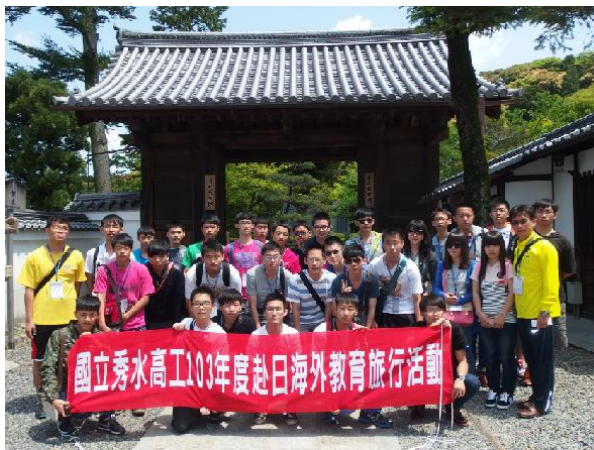
入口人潮多難等待只好旁邊將就一下