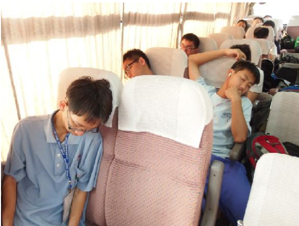
前往神戶途中-豐富多元的睡姿