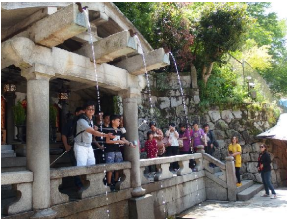
音羽之泉-弱水三千只…