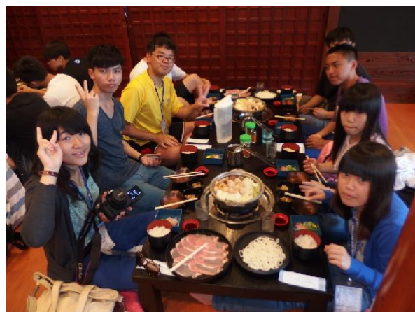
中午相撲火鍋外加雷神、抹茶冰淇淋