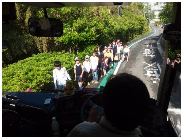
在台灣幾乎看不到的排路隊上學