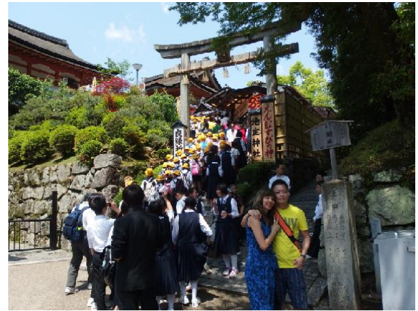
京都清水寺-前往參拜婚姻結緣神