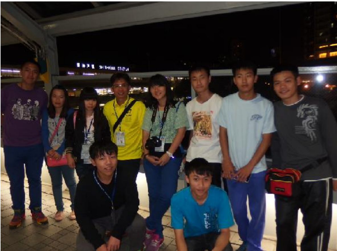
今晚雷神特攻隊-內藏癡漢