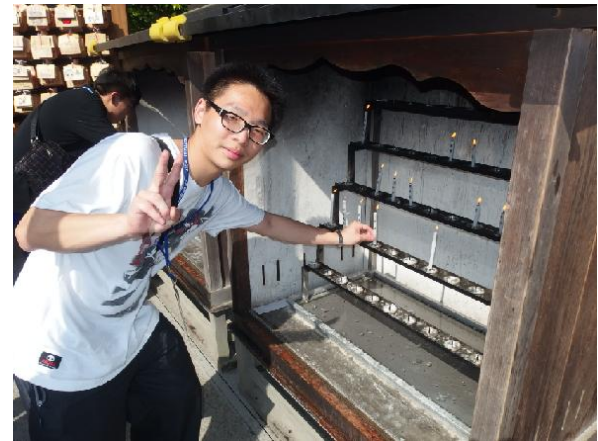
點許願蠟燭-透過煙將心願傳達至天廳