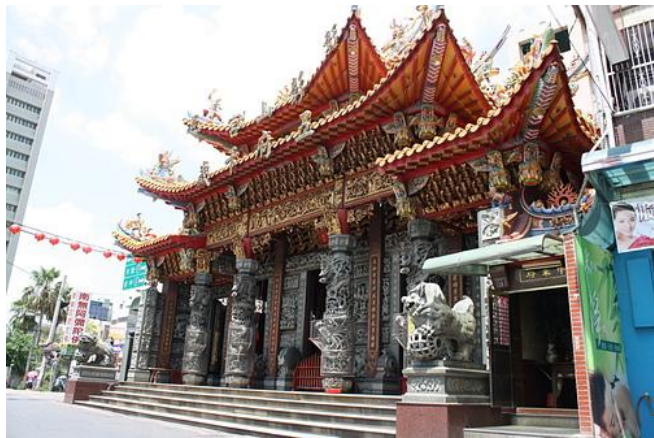
圖 3(註 6)

彰化縣志也記載，清朝乾隆卅五年（公元一七七〇年），官方爲了鎮撫半線社番人而興建「番社王爺宮」，多年後該廟被暴風雨摧毀，還由當地番人募款五十元修復，這些都可證明該神祇本爲半線社平埔族的信仰，直到該社漢化消失後，該王爺才被漢人「繼承」而繼續祭祀。